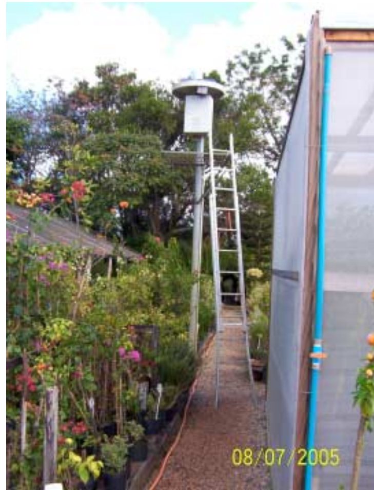
Posto Atibaia - Atibaia