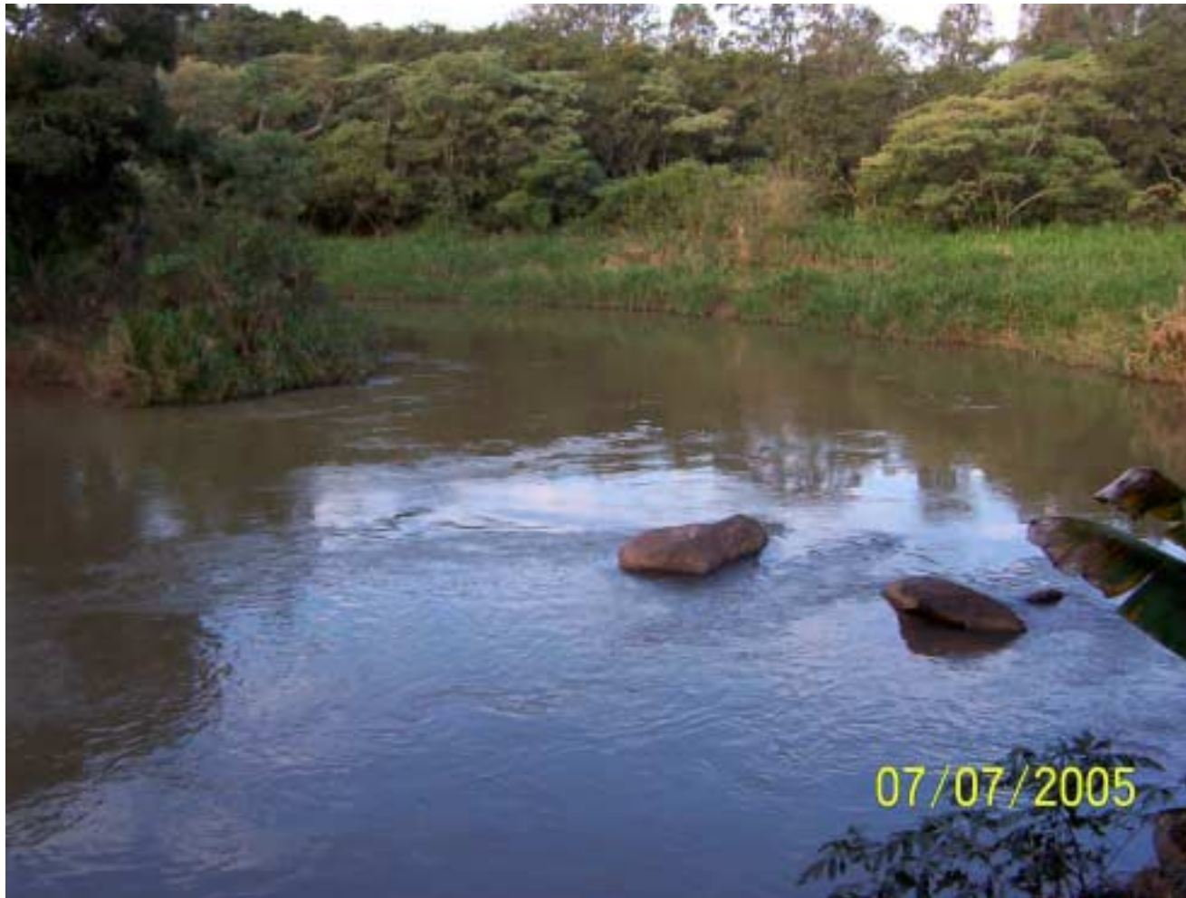
Rio Atibaia em Itatiba