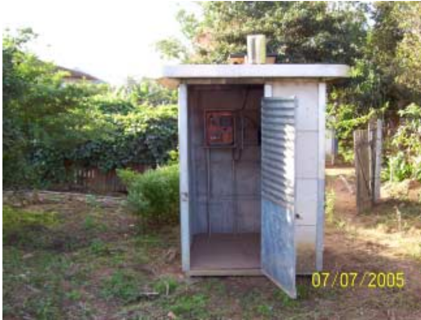
Posto Bairro da Ponte - Itatiba