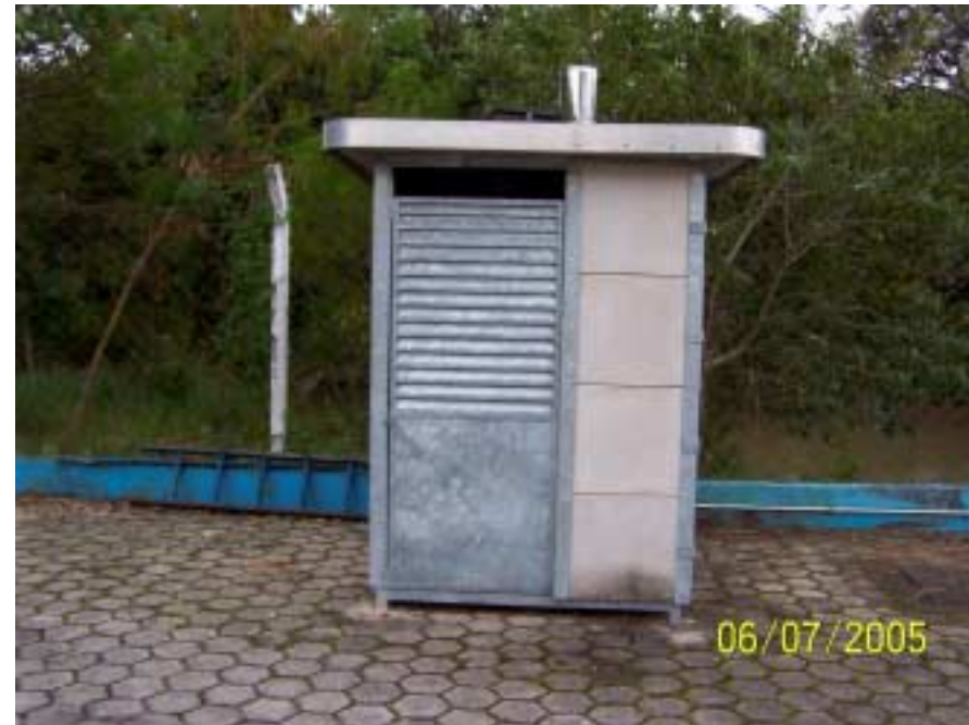
Captação Valinhos - Valinhos