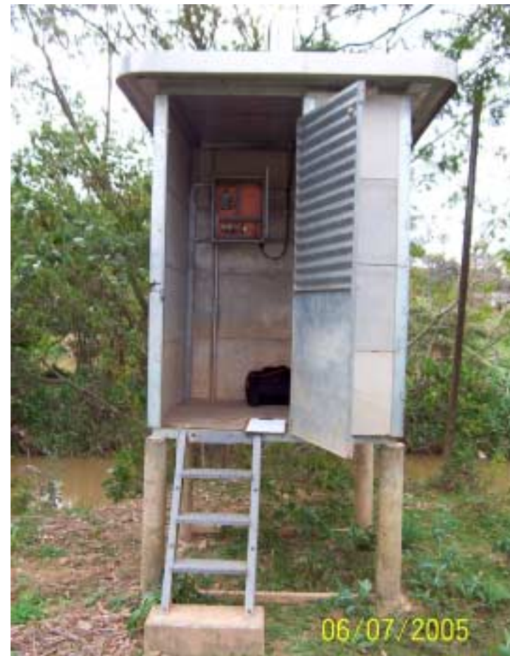
Posto Desembargador Furtado - Campinas