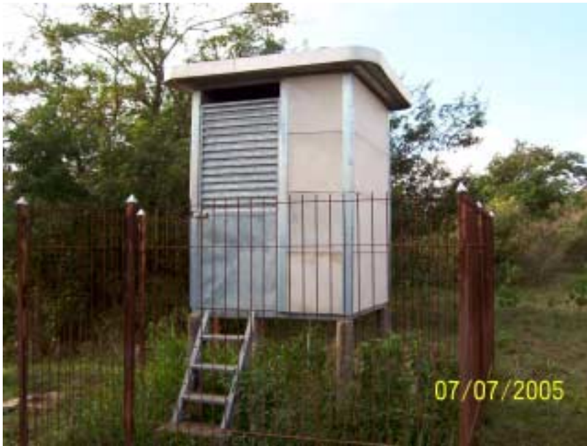
Posto Dal'Bo - Jaguariúna