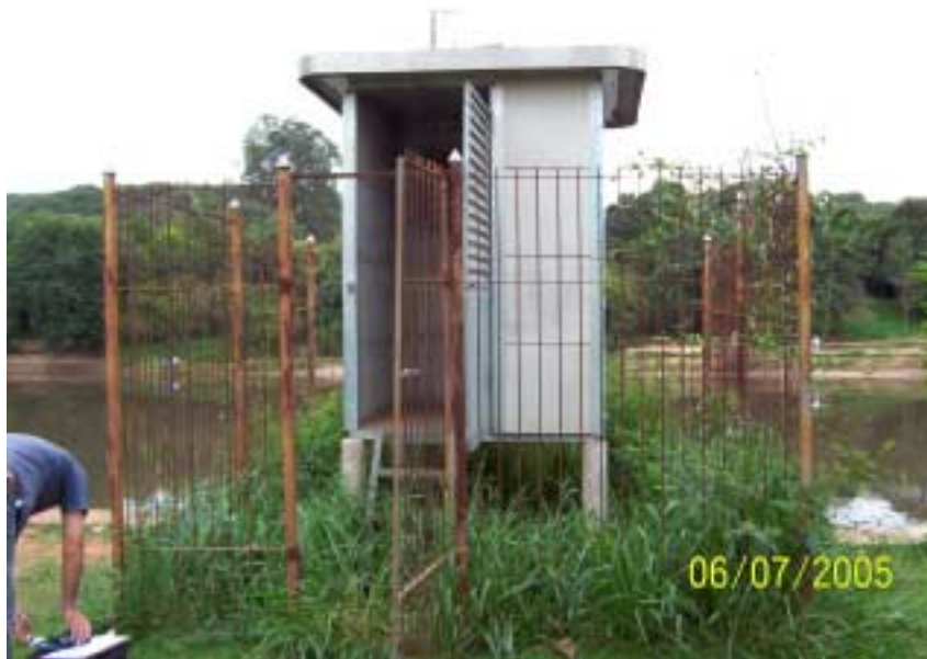
Ferrugem e mato no posto Piracicaba