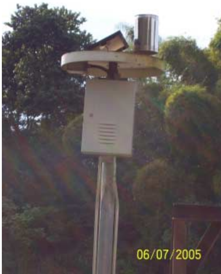
Posto Foz Jaguari - Limeira