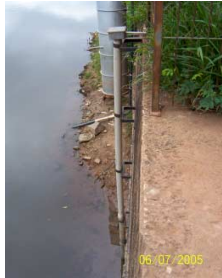
Sensor de nível deve ser rebaixado no posto Piracicaba