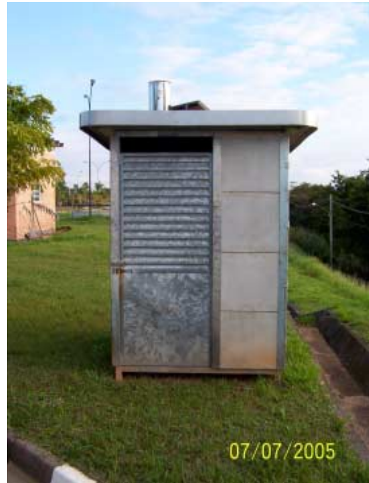
Posto Jaguariúna - Jaguariúna