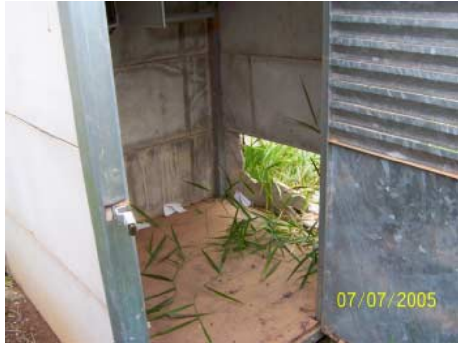
Sinais de Vandalismo no Posto Guaripocaba