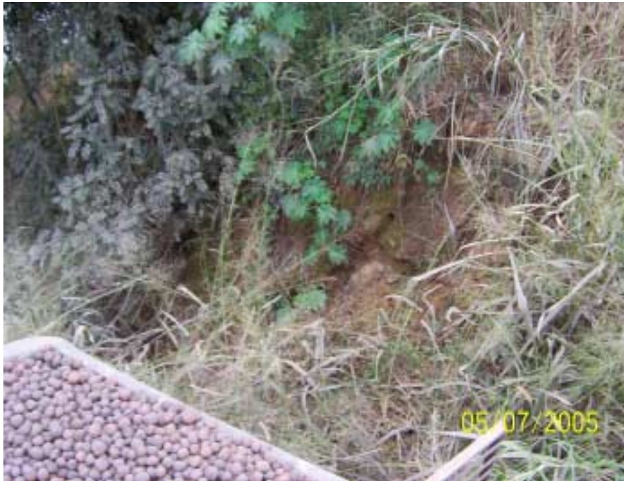
Erosão ao Lado Posto Usina Ester