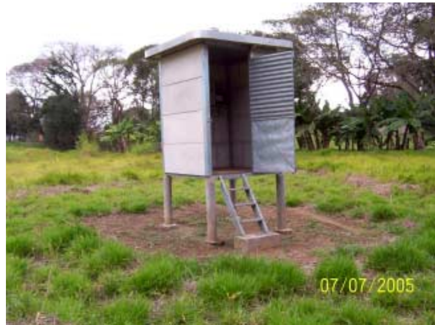
Posto Buenópolis - Morungaba