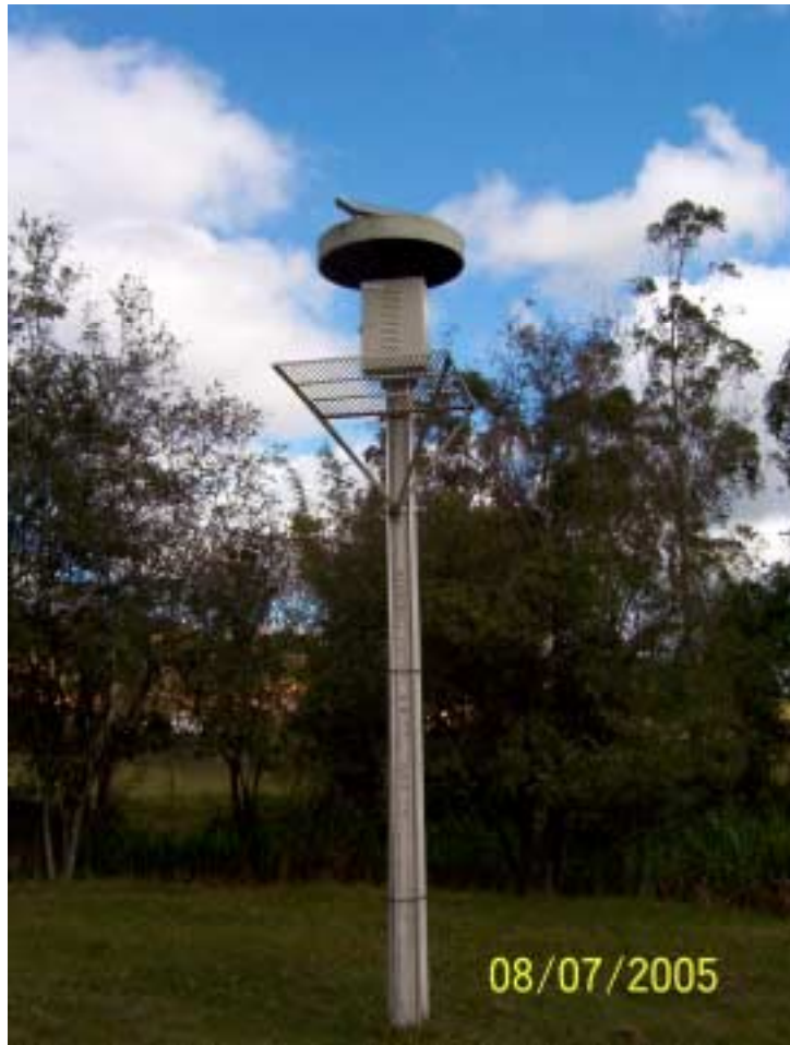
Posto Mascate - Nazaré Paulista