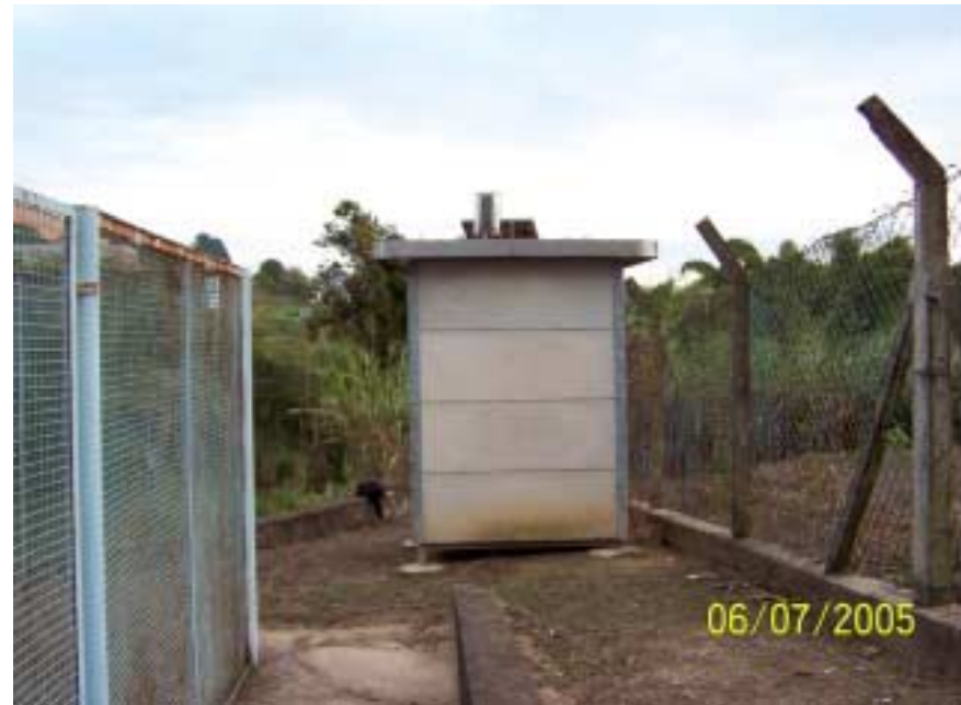
Posto Carioba - Americana