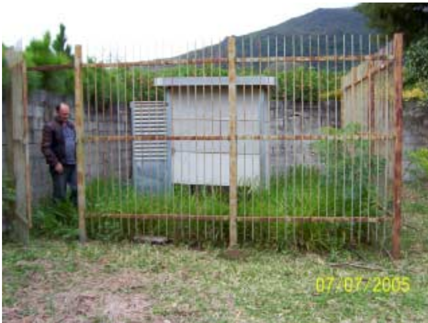
Posto Guaripocaba – Bragança Paulista