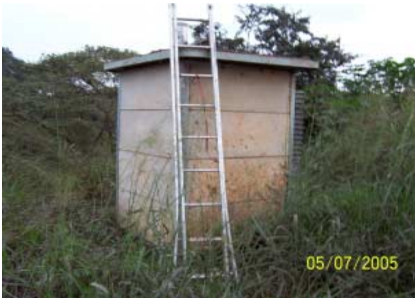
Posto Usina Estér - Cosmópolis