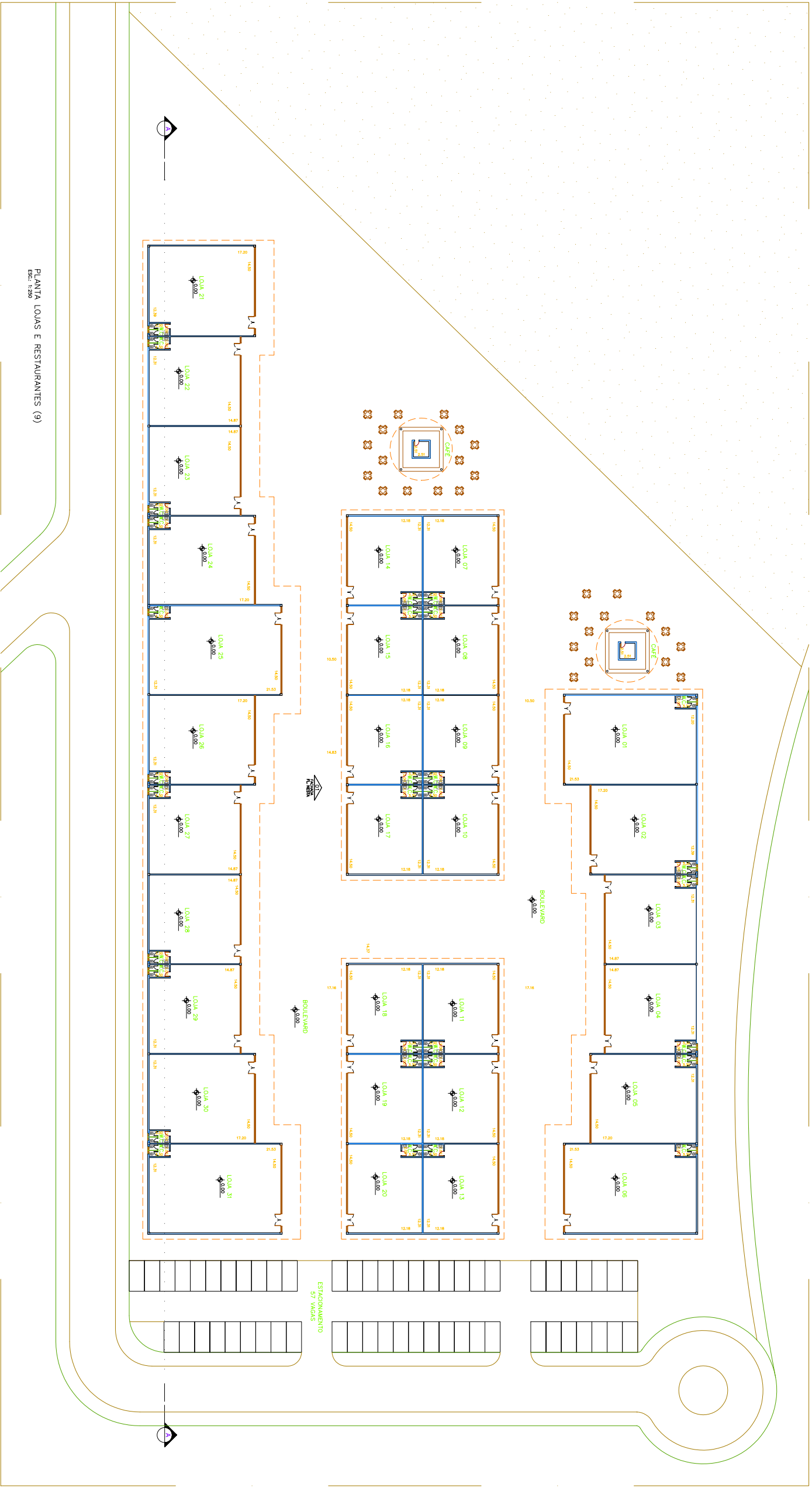
PLANTA LOJAS E RESTAURANTES (9)